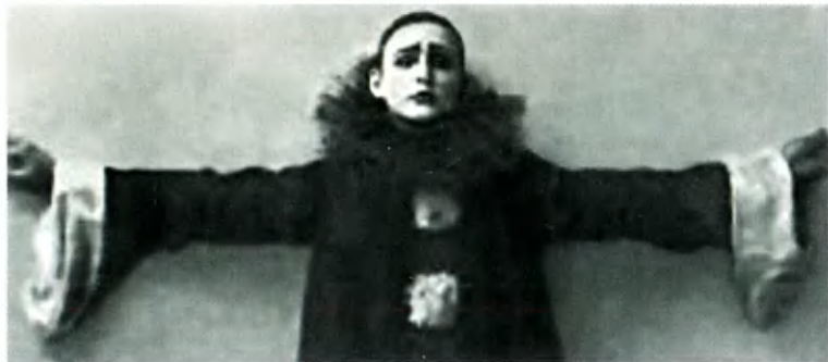
А. Вертинский — Черный Пьеро.