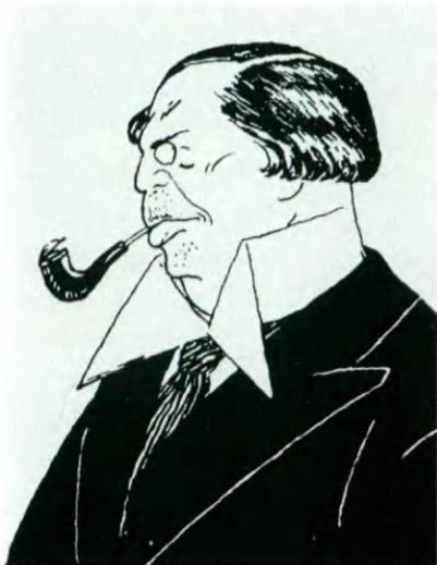
М. А. Кузмин. Шарж Н. И. Кульбина. 1913.