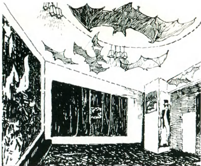
Зрительный зал и сцена кабаре «Летучая мышь».