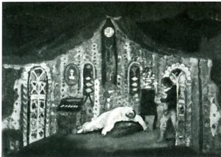
«Шарф Колумбины» А. Шницлера и Э. Донаньи. Эскизы Н. Н. Сапунова.