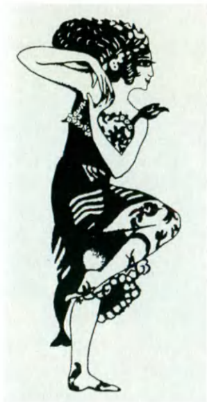
Т. П. Карсавина в роли Саломеи в спектакле «Бродячей собаки». Рисунок С. Ю. Судейкина. 1913.