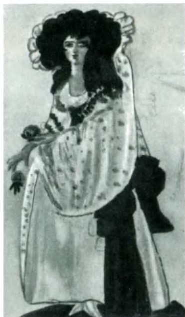
«Привал комедиантов». Роспись С. Ю. Судейкина.