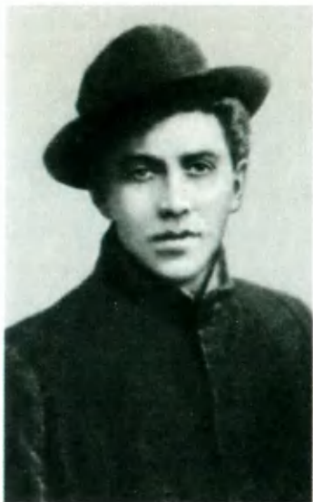
В. Э. Мейерхольд.