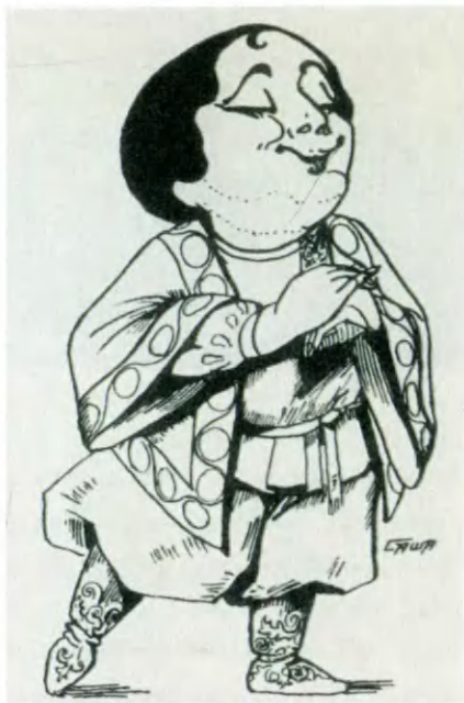
А. И. Загорская. Шарж А. Бродского.