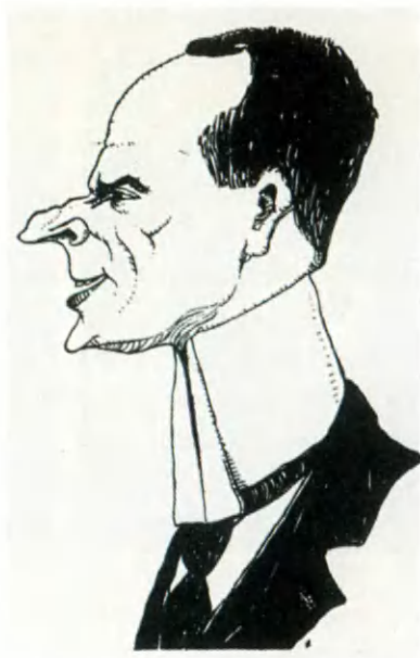
Я. Д. Южный. Шарж А. Бродского.