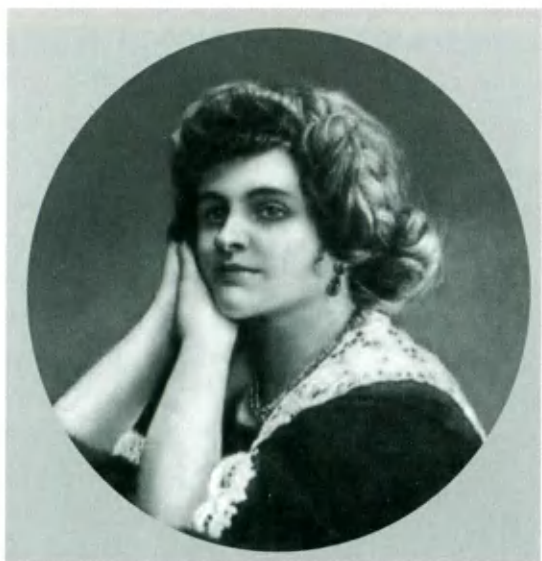
Н. А. Тэффи.