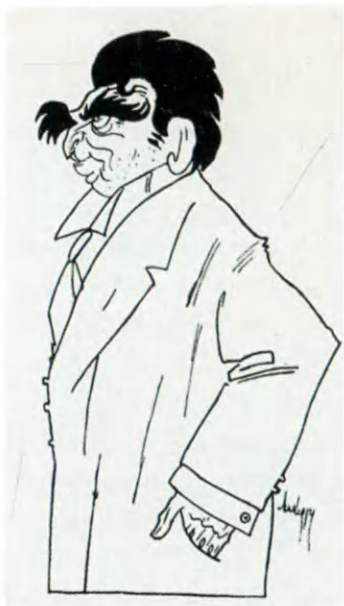
П. П. Струйский. Шарж.