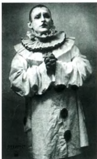
А. Вертинский. Фото 1910-х гг.