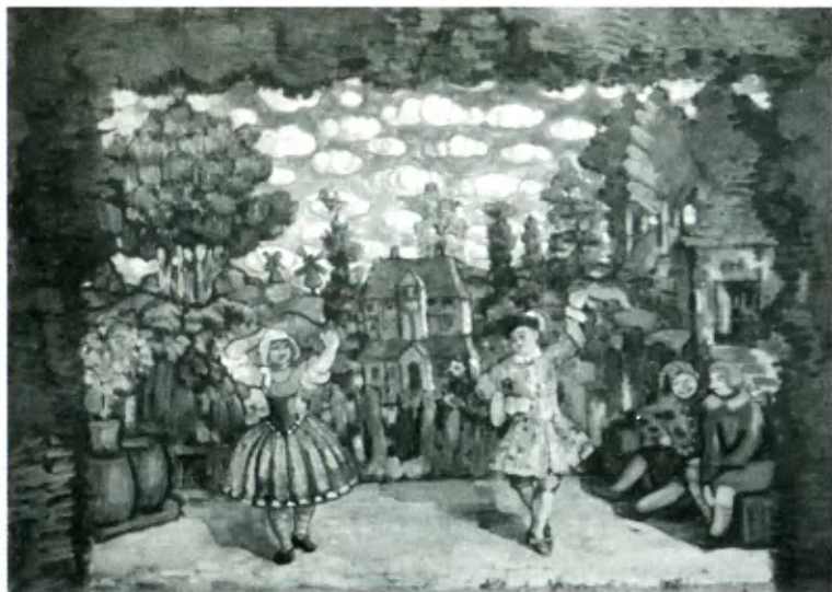
Пастораль М. А. Кузмина «Голландка Лиза». Эскиз Н. Н. Сапунова.