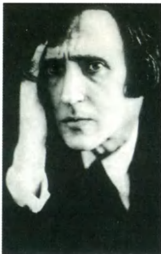
Н. Н. Евреинов. Фото середины 1910-х гг.

Декорация к монодраме «В кулисах души». Эскиз Н. Н. Евреинова. 1912.