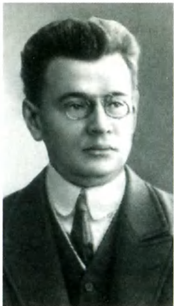
А. Т. Аверченко.