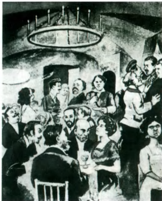
Открытие «Бродячей собаки» в 1912 году. Рисунок С. Животовского.