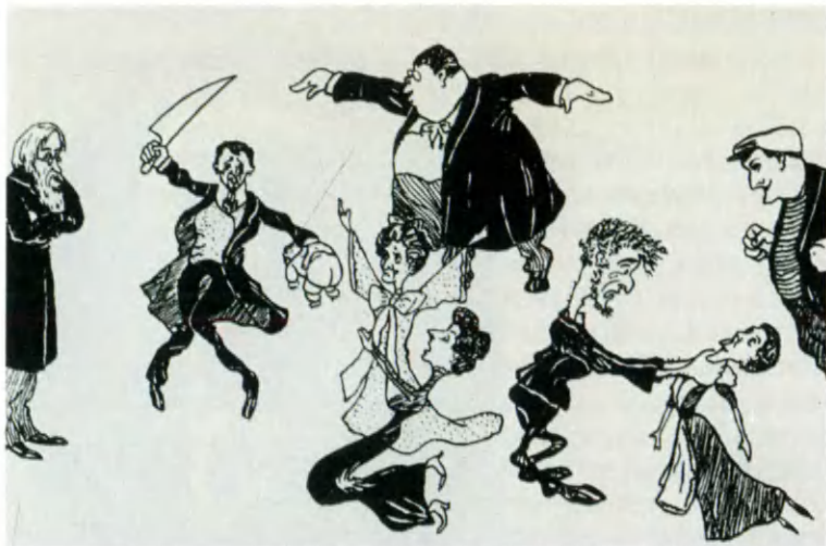
Спектакль Литейного театра. Карикатура В. А. Казанского.