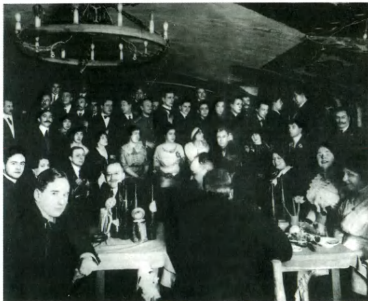
Вечер в «Бродячей собаке» в 1913 году.