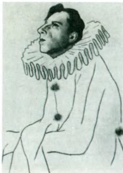
Всеволод Мейерхольд в костюме Пьеро. Рисунок Н. П. Ульянова. 1908.

Зал на Галерной улице, где играли спектакли «Дома интермедий».