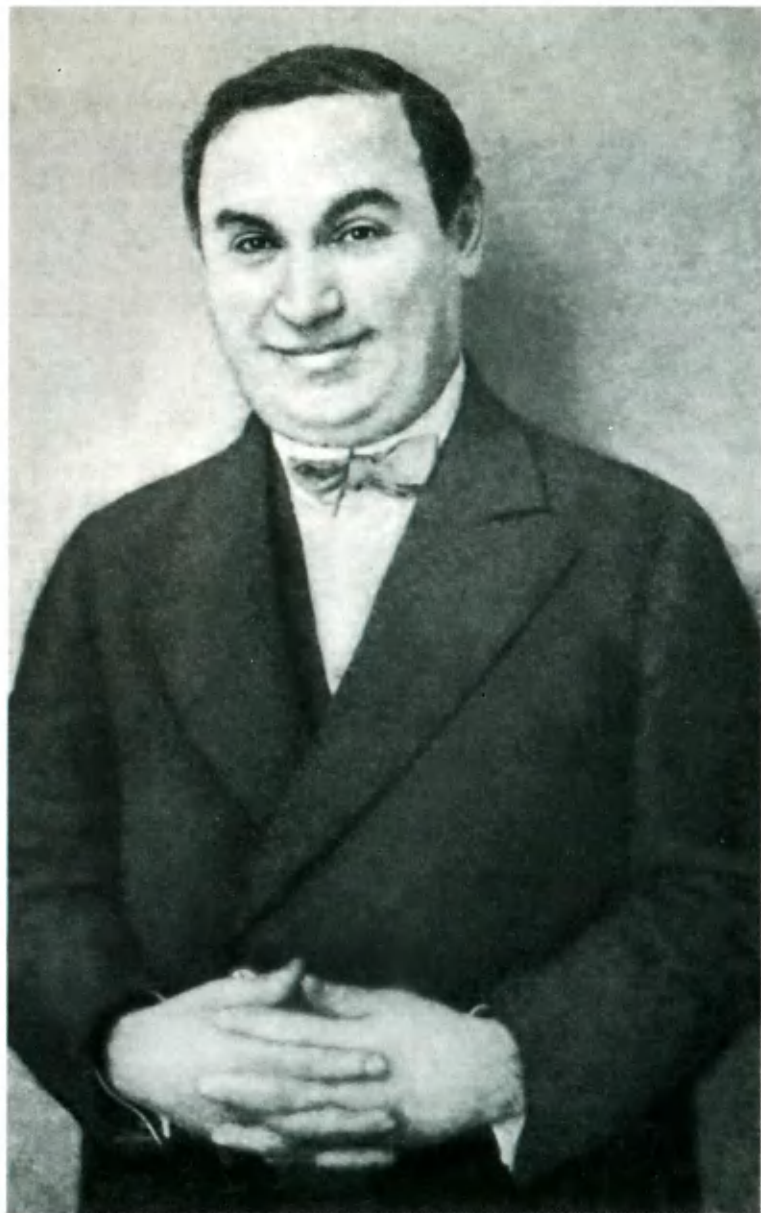
Н. Ф. Балиев, конференсье кабаре Московского художественного театра.