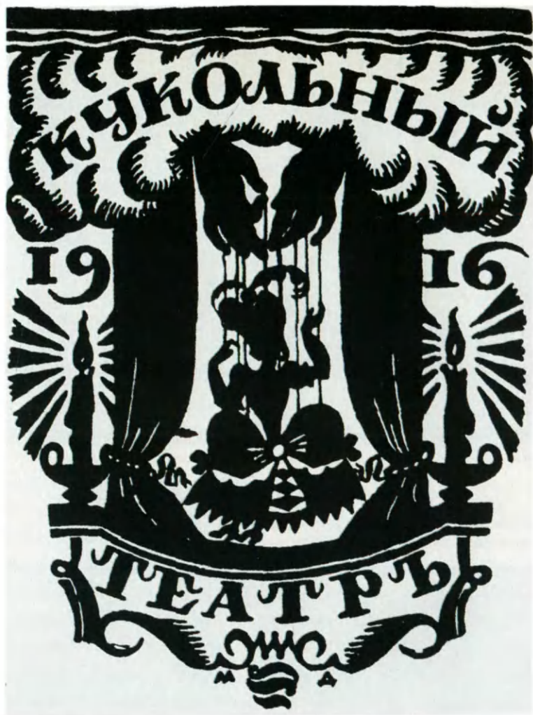
Обложка буклета для спектакля «Сила любви и волшебства». Рисунок М. В. Добужинского. 1916.