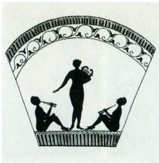
Постановка «Песен Билитис» Пьера Луиса в «Кривом зеркале». Рисунок М. Блиса.