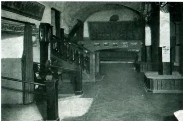
Фойе театра «Летучая мышь» в Б. Гнездниковском переулке.