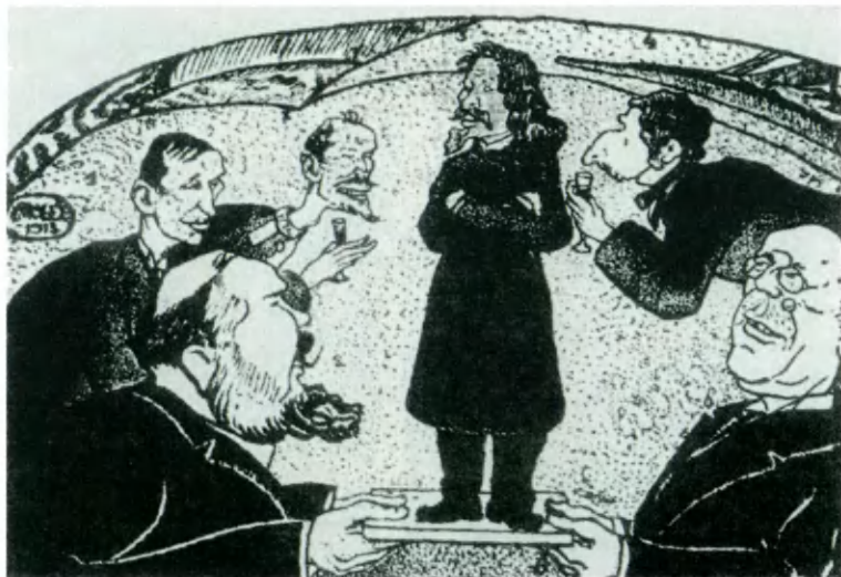
Чествование К. Д. Бальмонта в «Бродячей собаке». Карикатура М. Л. Шафрана.