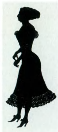
«Маленькое недоразумение». Рисунок А. Е. Яковлева.