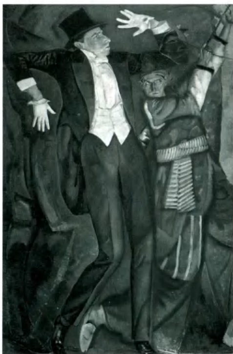
В. Э. Мейерхольд. Портрет Б. Д. Григорьева. 1916.