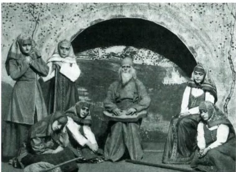
Сцена из инсценировки стихотворения Федора Сологуба «Заря Заряница».